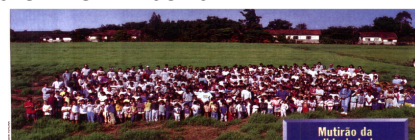
Fundamar atua de como falar com a terra para 520 crianças